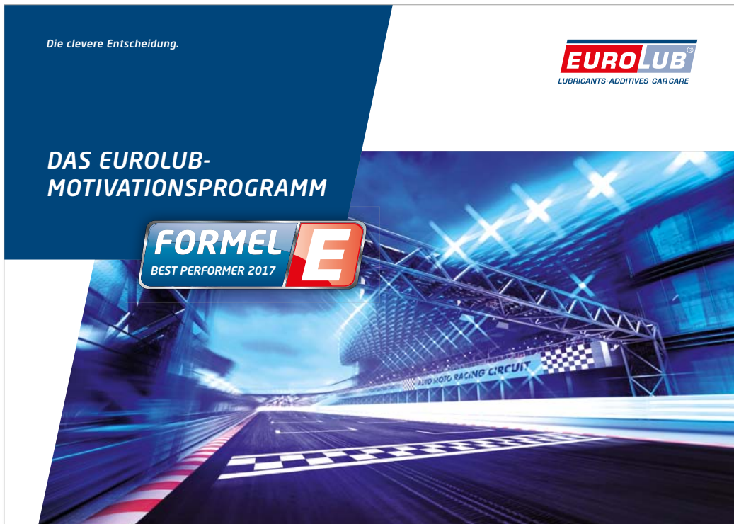
Aktionsbutton und Salesfolder Händlermotivationsprogramm